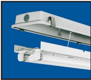
Insatsen hänger vid installation.