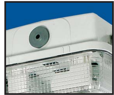
Kabelgenomföring i EPDM material.