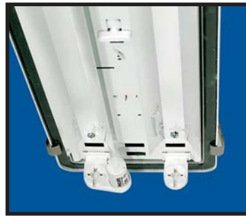
Mamba med reflektor.