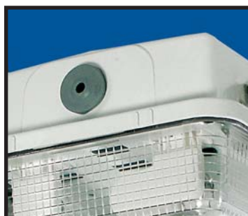
Kabelgenomföring i EPDM material.